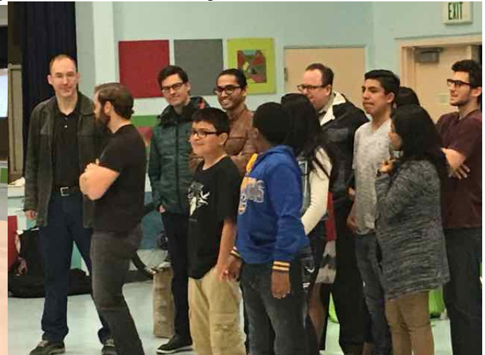
SPARK Mentorship Meeting! La junta con los mentores de SPARK!